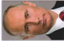
Владимир Путин, Президент РФ.

«Шахматы справедливо считают важной частью мировой культуры. И в России они традиционно пользовались и пользуются особым, заслуженным уважением. У нас особо ценят шахматы. Напомню, наша страна дала миру десять чемпионов. Этим видом спорта у нас занимается порядка 540 тысяч человек, а любители провести время за шахматной доской измеряются миллионами. В свое время шахматами занимались в каждой школе, в каждом районе и очень здорово, приятно, что сегодня эта традиция возрождается».