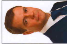
Дмитрий Медведев, председатель правительства РФ.

«Шахматы справедливо считают важной частью мировой культуры. И в России они традиционно пользовались и пользуются особым, заслуженным уважением. У нас особо ценят шахматы. Напомню, наша страна дала миру десять чемпионов. Этим видом спорта у нас занимается порядка 540 тысяч человек, а любители провести время за шахматной доской измеряются миллионами. В свое время шахматами занимались в каждой школе, в каждом районе и очень здорово, приятно, что сегодня эта традиция возрождается».