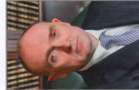
Борис Дубровский, губернатор Челябинской области.

«Нам необходимо продолжить реализацию программы и нашей национальной инициативы «Наша новая школа». Приоритеты последующих лет – это полноценное формирование новой системы поиска и поддержки юных талантов, переход к практически ориентированной модели образования в средней и старшей школе и превращение школы в центр жизни, а не только в место, где учат детей. Надо формировать и новое поколение учителей, которые обладают всеми навыками современной педагогики».